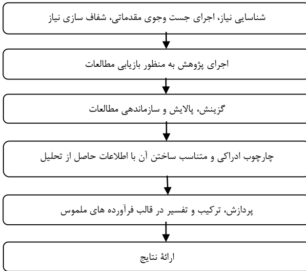
شکل ۱، الگوی شش مرحله‌ای سنتز پژوهی روبرتس (به نقل از مارش، ۱۳۸۷)

حال باتوجه به شکل ۱، به تشریح اقدامات انجام شده در هریک از مراحل پرداخته می شود: